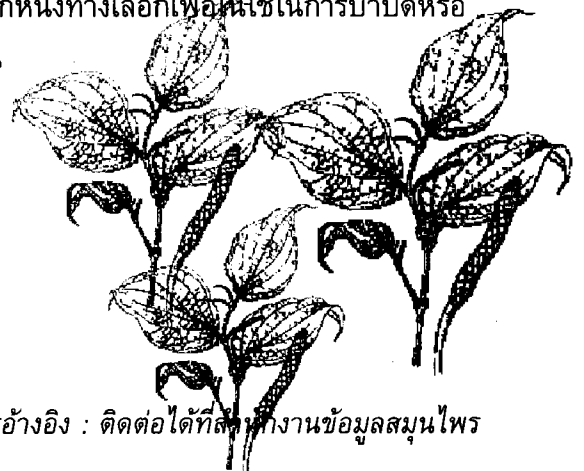
เอกสารอ้างอิง : ติดต่อดังที่กล่าวถึงงานข้อมูลสมุนไพร