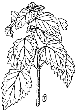
พืชมเสนหรือ Patchoeli ( Pogostemon cablin (Blanco) Benth.)