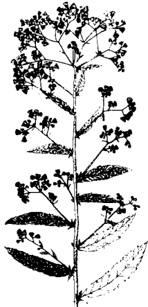
พืชมเสนหรือหนาดใหญ่หรือ Camphor tree ( Blumea balsamifera (L.) DC.)