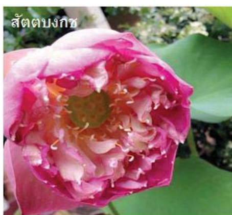
สัตตบงกช