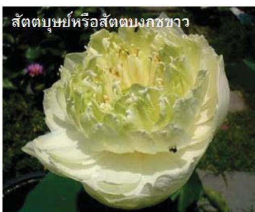
สัตตบุษย์หรือสัตตบงกชขาว