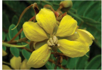
ขี้เหล็กเลือด ( Senna timoriensis )