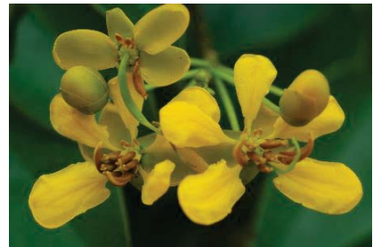
ขี้เหล็กสาร ( Senna garrettiana )