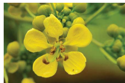
ขี้เหล็ก ( Senna siamea )